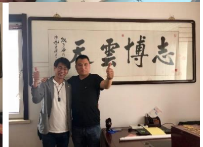
6월 8일 형계주 명예회장님 댁(북경 이화원 부근) 방문. 공식 전달을 위해 전통함과 포장을 형계주님께서 직접 자비로 너무 잘 준비해두셔서 감동이 더했습니다. (참고로 이번 일정 경비 및 비용은