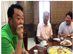
<내용은 형욱주 님 게시글 참조> Video Player 음소거 해제

톈진시 종친 모임에서 공식 뺏지 전달하고 관련된 의미에 대해 회장님 한 말씀 해주셨습니다.